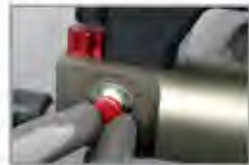
Velocidade de rebitagem

O operador pode, manualmente, ajustar a velocidade de avanço do cilindro e a força de pressão da rebitagem tendo em atenção o tipo de material que se vai unir, evitando dessa forma, qualquer tipo de deformação.