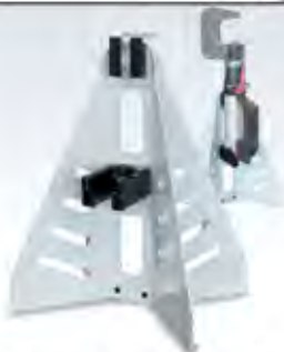
Suporte rebitadora Ref: 054158