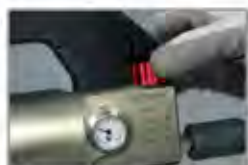
Pressão de ajuste de 0 a 8 bar